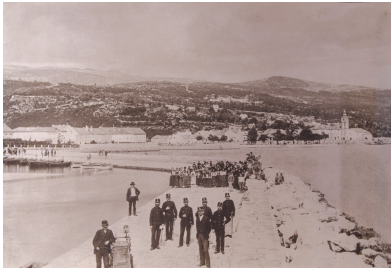
Pogled na Crikvenicu, detalj fotografije, 1891.