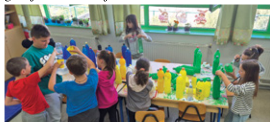
Kreativne aktivnosti učenika

koje doprinose ljepšem i čistijem svijetu. Iz Osnovne škole Zvonka