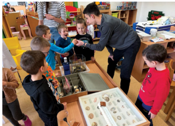
Mali stanovnici velike obale - učenici SŠ A. Barca u vrtiću