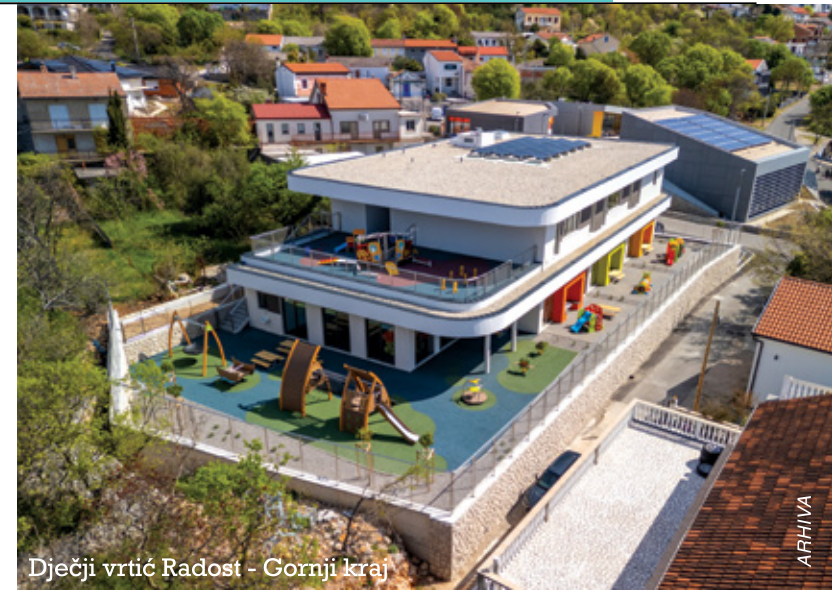
Dječji vrtić Radost - Gornji kraj