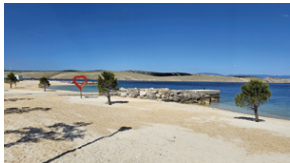
Plaža Grabrova Jadranovo