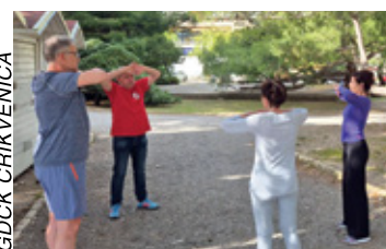
Medicinske vježbe u parku