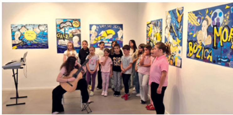
Otvorenje izložbe radova učenika OŠ Vladimira Nazora pod nazivom "Nazor i Crikvenica – desetljeće zajedništva"