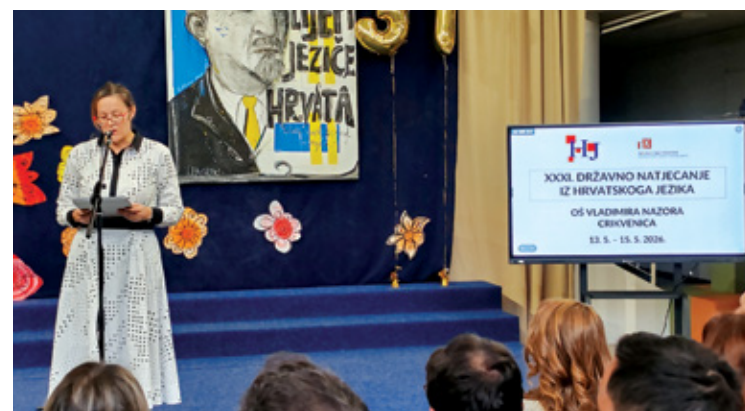
Nazočnima se obratila ravnateljica Škole