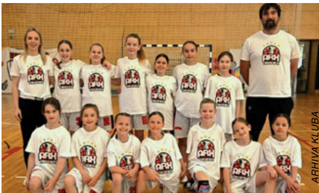
Državne prvakinja u mini košarci – U11 ekipa ŽKK-a Arx

U posljednje tri godine ŽKK Arx osvojio je niz odličja u mlađim kategorijama: naslov prvakinja Hrvatske U11 2026., treće mjesto U13 na državnom natjecanju, Final 4 Panonian Cupa, naslov U13 prvakinja Hrvatske 2025., prva mjesta u mini košarci 2025. i 2023., prvo mjesto U12 na Otvorenom prvenstvu Hrvatske 2024., drugo mjesto u Pannonia Cup ligi 2025. te drugo mjesto na državnom U11 natjecanju 2024.