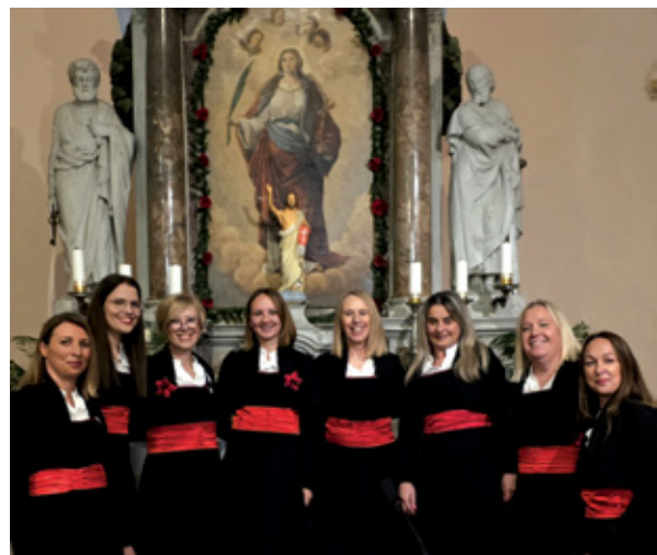
Klpa Sveta Jelena s prijateljima koncertom je otvorila Dane Svete Jelene

- u zajedništvu, veselju i pozitivnoj atmosferi. Dvotjedni program Jelene u Dramlju, odnosno Dana svete Jelene započeo je 16. svibnja tradicionalnim boćarskim turnirom i koncertom klape Sveta Jelena i prijateljica u mjesnoj crkvi. Nastavljen je teniskim turnirom, turnirom u pikadu za umirovljenike s područja grada Crikvenice i Vinodolske općine te radionicom izrade osvježivača pod nazivom „Mirisi Mediterana”. Vrhunac slavlja i zajedništva bio je 22. svibnja, na sam blagdan svete Jelene Križarice, a donio je bogati program događanja za sve generacije. Trenutak u kojem je zajednica slavila i disala kao jedno započeo je svečanim euharistijskim slavljem – misom koju je predvodio mladomisnik Riječke nadbiskupije Matija Luketić, u pratnji svećenika crikveničkog dekanata. Uslijedio je poseb-