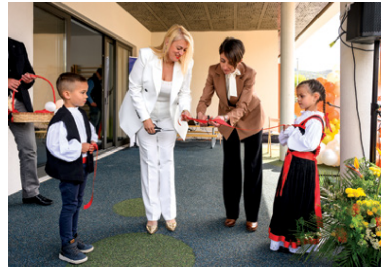
Svečanost otvorenja novog vrtića

Novi vrtić u Gornjem kraju zato je odgovor na stvarne potrebe obitelji, ulaganje u kvalitetu života i poruka da su djeca u središtu razvoja grada. To je prostor u kojem će mali koraci postati velike radosti – prve sigurnosti, prijateljstva, pjesme, nastupi i ponosi.