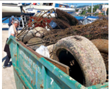
U akcijama čišćenja prikupljena je značajna količina otpada