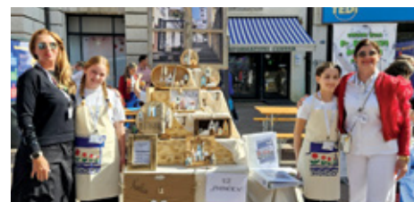
Predstavljanje na Korzu