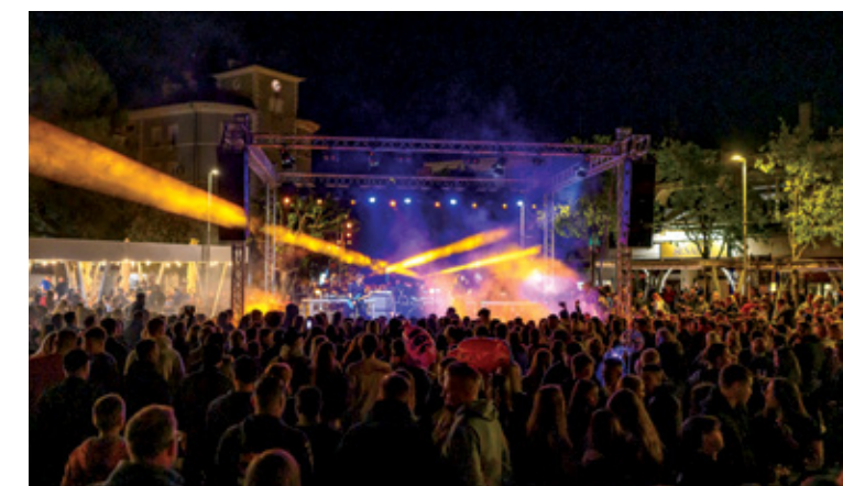
Mnoštvo mladih uživalo je u večernjem programu