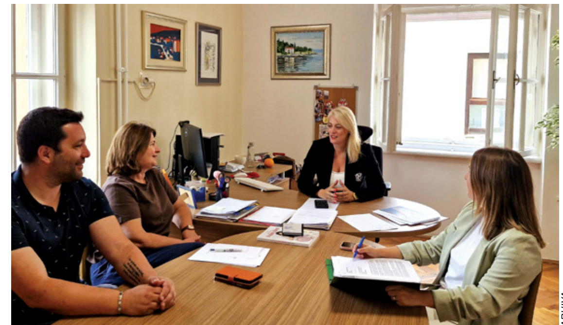
Gradonačelnica sa suradnicima

- Kada nakon truda i rada vidite zadovoljne ljude i benefite za zajednicu, taj je osjećaj nezamjenjiv i ono što me gura naprijed. Želim ostaviti prepoznatljivu Crikvenicu i vratiti joj stari sjaj. Također, želim Crikvenicu koja predstavlja održivu zajednicu, onu u kojoj se ljudi ugodno osjećaju, kvalitetno žive i u kojoj mladima možemo omogućiti sve razine obrazovanja, uključujući visokoškolsko – grad u kojem će naša djeca ostajati i podizati svoje obitelji.