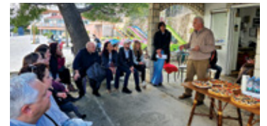
Posjet PŠRD Arbun-u