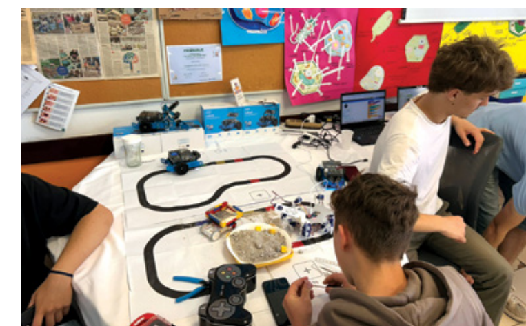
Veliku pažnju privukli su roboti i način njihova funkcioniranja