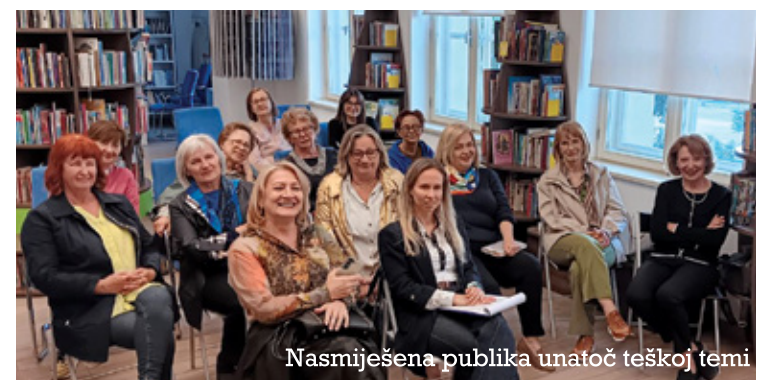
Nasmiješena publika unatoč teškoj temi