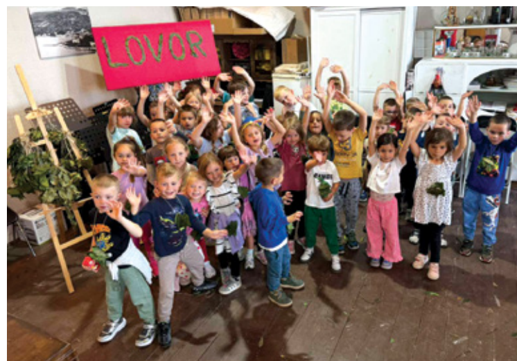
Skupine Šareni svijet i Delfini u posjetu KUD-u Neven Selce

Posebno ih je razveselio obilazak škole tijekom kojeg su upoznali različite prostore i djelatnike škole. Posjetili su ravnateljicu, tajnicu, psihologinju, pedagoginju i ostale djelatnike koji su ih srdačno dočekali i počastili. Ovakvi susreti djeci omogućuju postupno i pozitivno upoznavanje s novim okruženjem te jačaju osjećaj sigurnosti i pripadnosti.