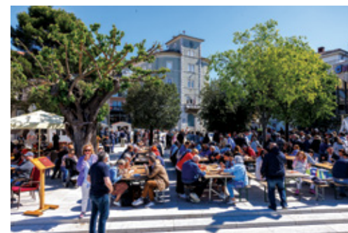
Građani i gosti uživali su u prvomajskoj maneštri

Poslijepodnevni sati bili su rezervirani za Prvomajski BBQ na terasi hotela Omorika. Uz glazbu