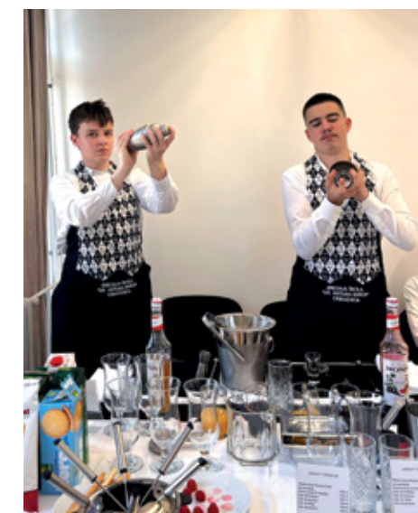
Predstavljanje smjera konobar

Mnogi su nakon programa rekli da im je upravo takav način predstavljanja škole pomogao da lakše zamisle sebe kao buduće srednjoškolce i sigurnije razmisle o svojem budućem zanimanju.