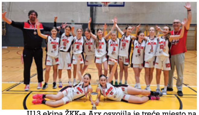
U13 ekipa ŽKK-a Arx osvojila je treće mjesto na državnom prvenstvu Hrvatske

JD VAL NIŽE USPJEHE: OD TRENINGA NAKON ŠKOLE DO REPREZENTATIVNOG DRESA