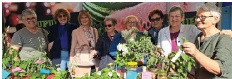
Članice Udruge pokazale su koliko se zdravlja i bogatstva krije u prirodi koja nas okružuje

Dolaskom proljeća aktivnosti Udruge umirovljenika Grada Crikvenice i Vinodolske općine postale su gotovo svakodnevica. Ovo im je godišnje doba najprije donijelo miris Uskrsa i podsjećanje na običaje koji se u ovom kraju njeguju s posebnom pažnjom. Naime, krajem ožujka, uoči Cvjetnice, članovi Udruge pleli su maslinove grančice, a uskršno ozračje nastavljeno je uz domaće delicije i vrijedne ruke članica Udruge s obzirom na to da je za goste i sugrađane trebalo obojiti čak 800 jaja, pripremiti 30 kilograma šunke, ispeći pogače, orehnjače i brojne druge slastice. U tom su zadatku članovi Udruge imali i pomoć članova iz selačke i jakovarske podružnice. Osim što čuvaju, članovi ove umi-