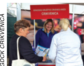
Mjerenje tlaka i šećera