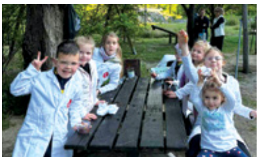
Radionica za male istraživače bila je spoj zabave i učenja kroz raznolike STEAM aktivnosti