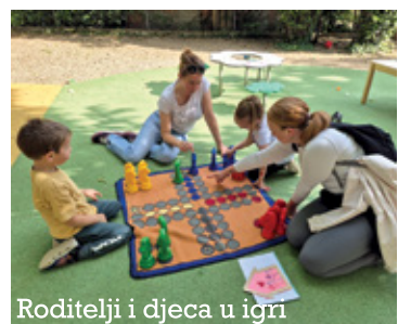
Roditelji i djeca u igri

Društvo Naša djeca Grada Crikvenice zahvaljuje svim sudionicima, partnerima, volonterima, odgojiteljima i suradnicima koji su svojim trudom, energijom i angažmanom pridonijeli uspješnoj organizaciji i provedbi Festivala. Posebna zahvala upućuje se svim obiteljima koje su svojim dolaskom podržale