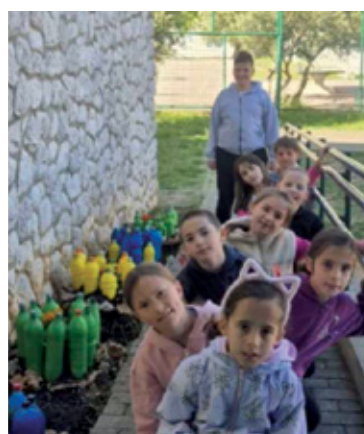
Akcija čišćenja dvorišta

Cara poručuju kako su ponosni na svoje male ekološke čuvare koji su još jednom pokazali koliko velik trag mogu ostaviti –