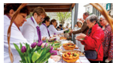
Uskrs u Crikvenici

edukativnim radionicama u Crikvenici 28. ožujka, gdje su posjetitelji imali priliku upoznati tradi-