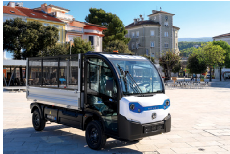
Električno komunalno vozilo Goupil G4 L

Ulaganje u ovakva vozila predstavlja konkretan korak prema modernijoj komunalnoj usluzi. Za građane i posjetitelje to zna-