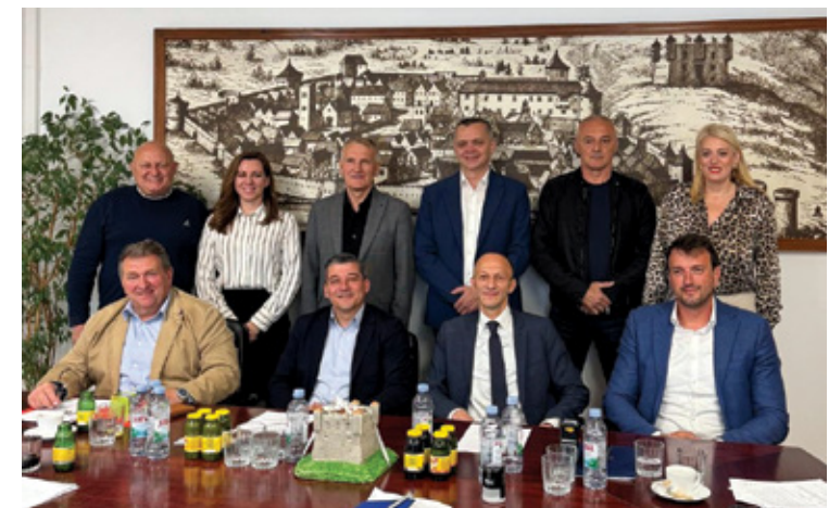
Potpisnici Sporazuma o zajedničkom financiranju obnove spomenika hrvatskim braniteljima u Zalužnici