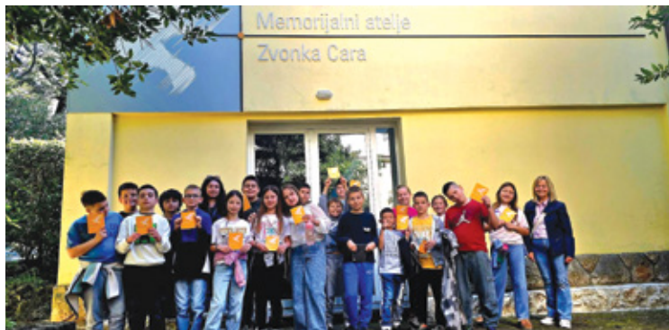
Posjet učenika OŠ Zvonka Cara Memorijalnom ateljeu Zvonka Cara