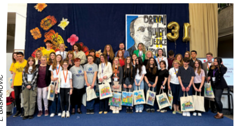
Sudionici državnog Natjecanja