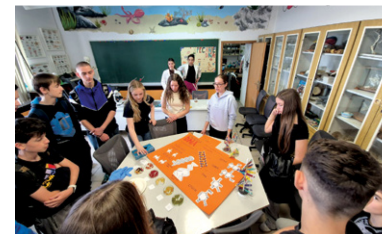
U opuštenoj atmosferi osmaši su imali priliku sudjelovati u interaktivnim radionicama

djelovanju i ugodnom druženju. Drago im je što su imali priliku predstaviti svoju srednju školu i pokazati dio onoga što svakodnevno rade. Budućim srednjoškolicima žele puno uspjeha u završetku osnovne škole i odabiru daljnjeg obrazovanja te se vesele dolasku novih generacija.