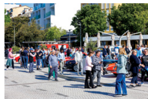
Izložba Oldtimera privukla je brojne posjetitelje

Tria Crikvenica i mirise roštilja, posjetitelji su uživali u opuštenom druženju uz more.