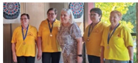
Ženska ekipa „Sunca“ osvojila je 2. mjesto na turniru u pikadu