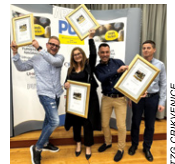
Simply the best TZG Crikvenice

tetu i autentičnost projekata koji uspješno povezuju gastronomiju, lokalnu tradiciju i suvremene turističke trendove te dodatno promoviraju identitet Rivijere Crikvenica. Nagrade predstavljaju i poticaj za daljnji razvoj inovativnih sadržaja i unaprjeđenje turističke ponude destinacije.