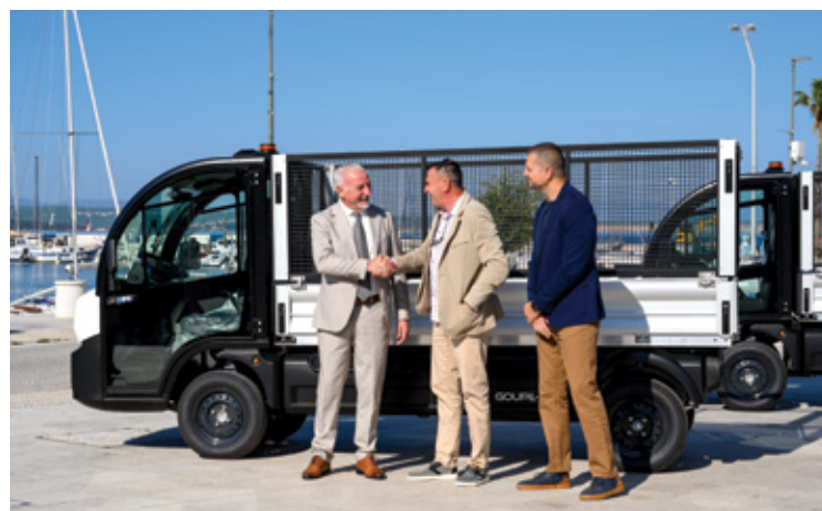
Predstavnici tvrtki EKO-MURVICA d.o.o. i EOL-EKOS d.o.o.

či urednije javne površine, bolju operativnu spremnost i učinkovitiji rad službi koje svakodnevno brinu o izgledu i funkcionalnosti grada. Za djelatnike Eko-Murvice nova vozila znače kvalitetniju radnu podršku, lakše obavljanje zadataka i veću fleksibilnost u organizaciji posla.