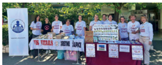
DND Grada Crikvenice i Sretne šapice u akciji

Brojni građani, volonteri i ljubitelji životinja svojim su donacijama podržali akciju prikupljanja pomo-