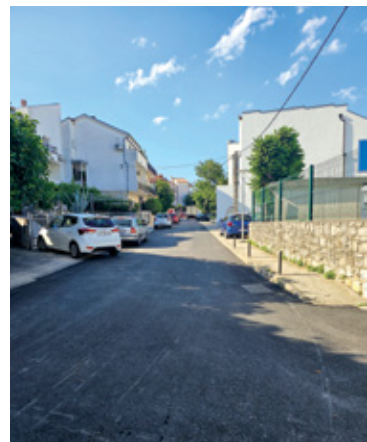
Ulica A. Antića Selce