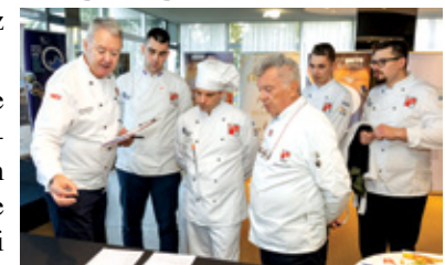
Hrvatski kuharski kup

Program su dodatno obogatile stručne kulinarske i vinske radionice, a događanje je još jednom potvrdilo važnost gastronomije u promociji lokalne tradicije i razvoju održivog turizma na Crikveničko – vinodolskoj rivijeri.