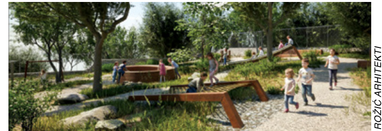
Vizualizacija uređenja parka u produžetku igrališta